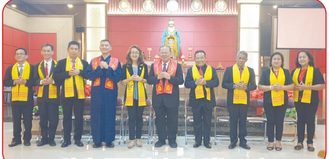
Pelantikan MAKIN Tasikmalaya Masa Bakti 2022-2026.