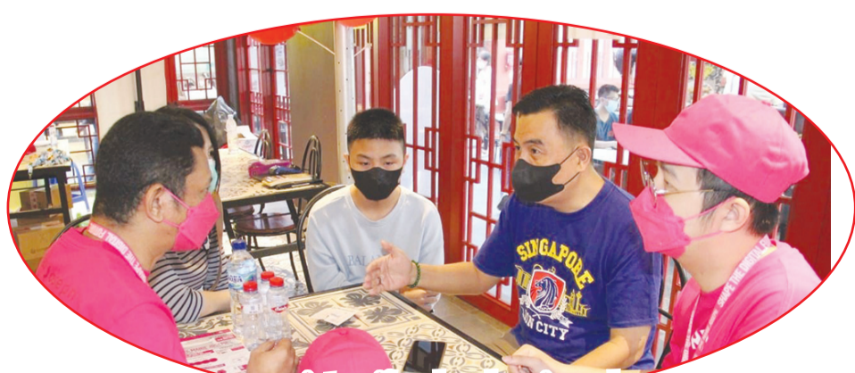
Penjelasan secara intensif pada calon siswa dan orang tua.

Marie Joseph Kelapa Gading yang memfokuskan pada Teknologi Informasi Komunikasi, Seni dan Ekonomi Kreatif. Di era digital dan kemajuan teknologi yang sulit dibendung, mau tidak mau kita harus siap menghadapi serangan teknologi digital. "Adanya perkembangan penggunaan teknologi dalam kehidupan sehari-hari yang begitu pesat sementara di sisi lain kurangnya ketersediaan tenaga kerja di bidang teknologi yang tidak dapat mendukung perkembangan penggunaan teknologi ini, maka berdirilah SMK Marie Joseph, yang berada di bawah