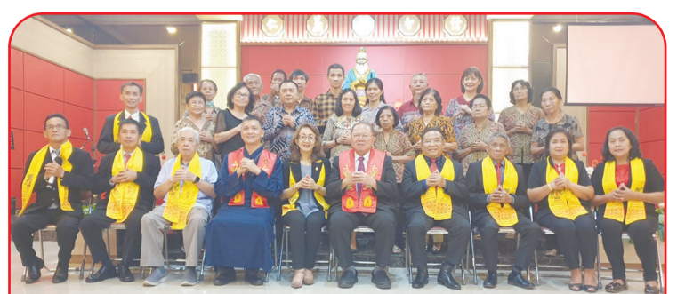
Turut hadir dalam pelantikan MAKIN Tasikmalaya pengurus MAKIN Banjar dan Ciamis.