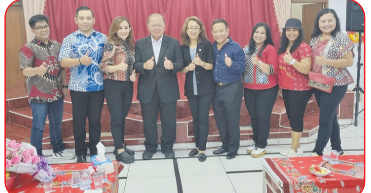
Bertfoto bersama selepas pelantikan MAKIN Cimanggis.