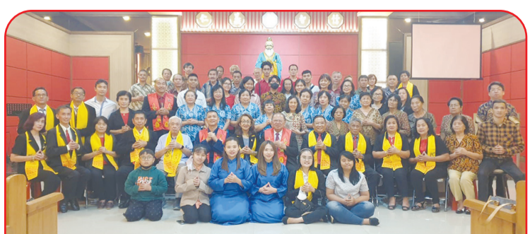
Bertfoto bersama seluruh hadirin selepas pelantikan MAKIN Tasikmalaya.