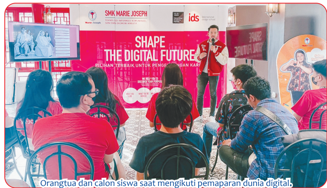
Orang tua dan calon siswa saat mengikuti pemaparan dunia digital.

JAKARTA (IM) - Berempat di Old Shanghai, Sedayu City, Jakarta Timur, Sabtu (5/11) dan Minggu (6/11), SMK Marie Joseph-Kelapa Gading, memberikan edukasi sekaligus pemaparan dunia digital. Pemaparan sekaligus penjelasan pendidikan SMA dan SMK untuk kejenjang berikutnya, antusias diikuti calon siswa dan orang tua yang menginginkan putranya selain bersekolah juga memiliki keterampilan khusus. Dalam acara ini, juga disampaikan adanya jalinan Kerja Sama SMK Marie Joseph dengan Cisco Akademi dan International Design School, sekaligus launching SMK